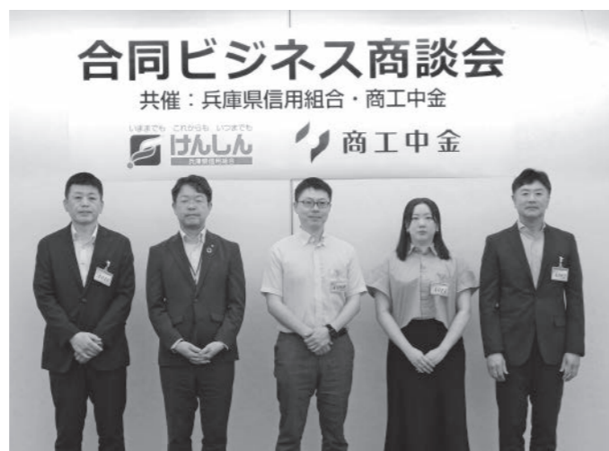
【場所：兵庫県信用組合本店】

中央会では、地域金融機関と連携し、全国ネットワークを生かしたビジネスマッチングを通じて、会員等の販路開拓を強力にサポートしてまいります。